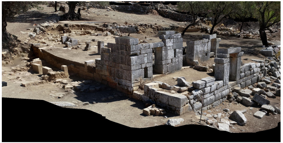
Apollon Kutsal Alanı ve Kızlan Kilisesi. 3D tarama: M. Serhat Aydemir

Alanda gerçekleştirdiğimiz temizlik çalışmalarının ardından, Apollon Kutsal Alanı içerisinde yer alan Kızlan Kilisesi'nde kazı çalışmalarına başladık. Yürütülen kazı çalışmalarında arkeolojide kabul gören ve bir terminoloji standardı bulunan Locus-Lot sistemini uyguladık.* Kazı çalışmalarının ilk sezonunda