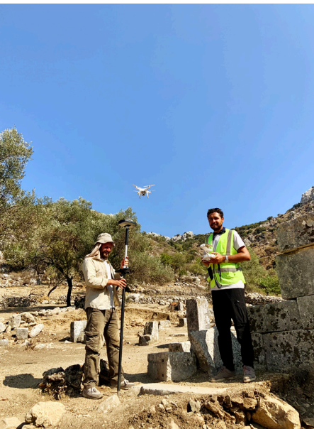
Haritalama çalışmaları.

2022 yılı Apollon Kutsal Alanı ve Kızlan Kilisesi içerisinde ve çevresinde gerçekleştirilen kazı ve temizlik çalışmaları sırasında, toplamda 9 adet yeni yazıtlı blok gün yüzüne çıkarttık. Epigrafi çalışmalarının bir diğer ayağını yüzey araştırmaları oluşturdu. Bu çalışmalar esnasında toplamda 13 adet yeni yazıtlı blok tespit ettik. Kentin tarihi adına oldukça önemli veriler sağlayan bu yazıtların lokasyonlarını hassas GNSS ile