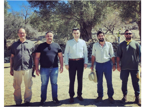
YİKÖB ziyareti.