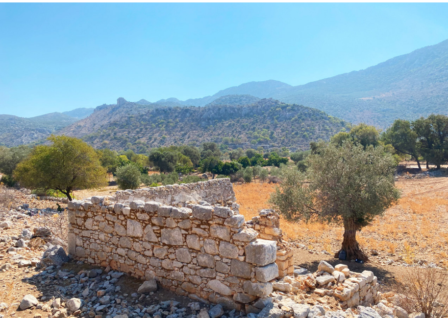
Yukarı Fenaket.

Aşağı Fenaket Köyü kalıntıları çevresindeki saha çalışmalarını tamamladıktan sonra araştırmalara 1923 yılı nüfus mübadelesinde terk edildiği söylenen bir diğer mahalle olan Yukarı Fenaket (Phoinikoudi)'te devam ettik. Bu alanda yürüttüğümüz çalışmalarda Orta Çağ ve Geç Osmanlı Dönemi'nde kullanılmış, Aşağı Fenaket evleriyle benzer 38 köy evi, 7 sarnıç ve zeytinyağı