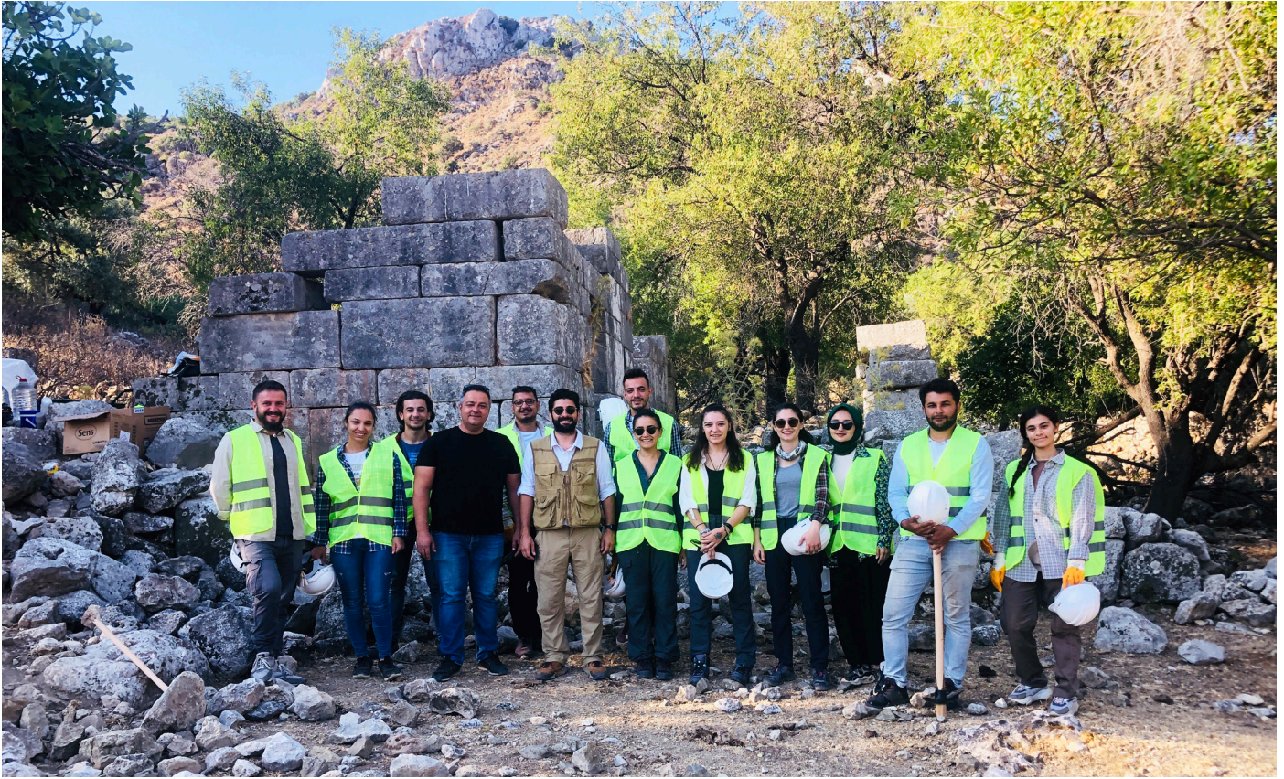
2022 yılı Phoenix ekibi.