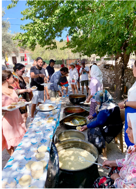
'Yüz yıl önce - yüz yıl sonra' gastronomi etkinliğimiz.

Phoenix Arkeoloji Projesi kapsamında yürütülen bilimsel saha çalışmalarının yanı sıra içerisinde bulunduğumuz yöreye somut katkı sunmak ve farkındalık yaratmak adına kültürel miras çalışmaları gerçekleştirilmektedir. Taşlıca Köyü halkıyla iç içe yürütülen projemiz kapsamında, yöre halkına Phoenix Antik Kenti gezdirilmiş ve yürütülen çalışmalarla ilgili bilgi seminerleri verilmiştir. Bu seminerler dışında, Marmaris İlçe Milli Eğitim Müdürlüğü ile birlikte öğrencilere kültürel miras farkındalığı kazandırmak amacıyla okullarda arkeoloji kolları oluşturulmuş, öğrenci ve öğretmenler ile Marmaris Müzesi ve çevre antik kentlere ziyaretler gerçekleştirilmiştir. Kültürel miras