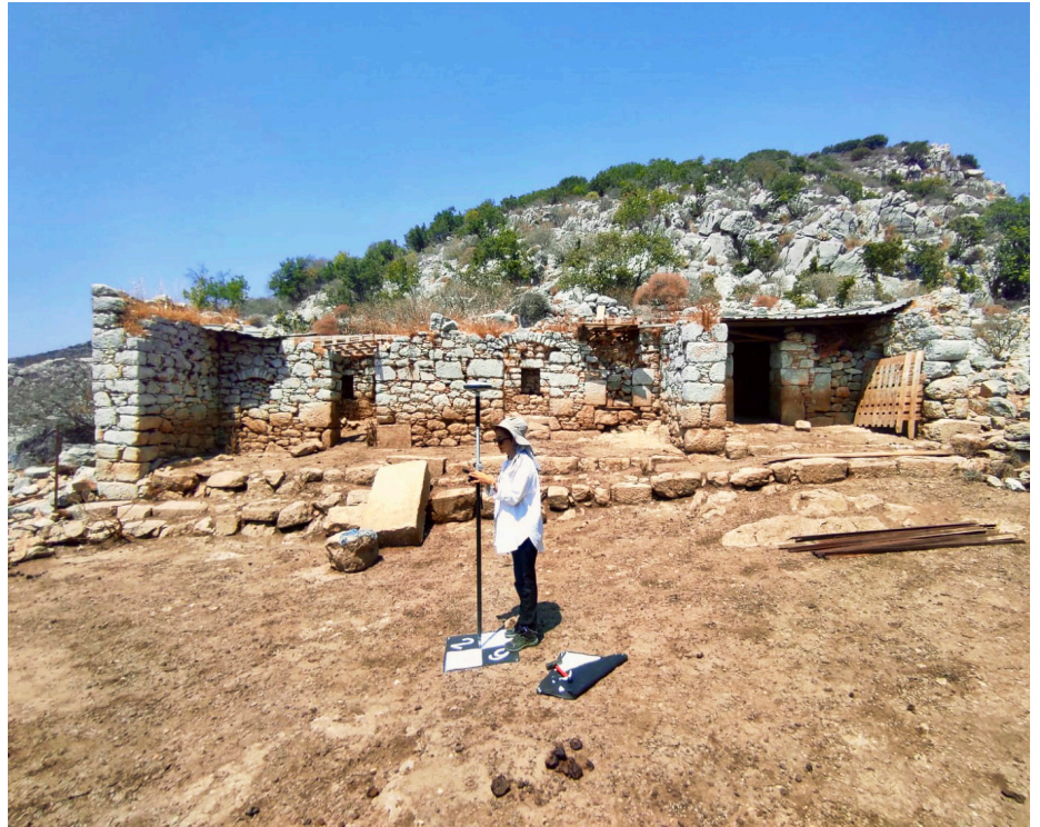
Y. Mimar M. Rumeysa Çakan tarafından yürütülen kırsal mimari çalışmaları.

iki odalı konut, ön avlulu-üç odalı konut şeklinde üç farklı plan tipolojisinde inşa edildikleri ve bütün yapılarda ön avlular sabit olarak kullanılmış olup oda sayıları değişiklik gösterdiği anlaşıldı. Yapıların malzeme ve yapım tekniği bakımından incelenmeleri de titizlikle tamamlandı. Taş ve tuğla