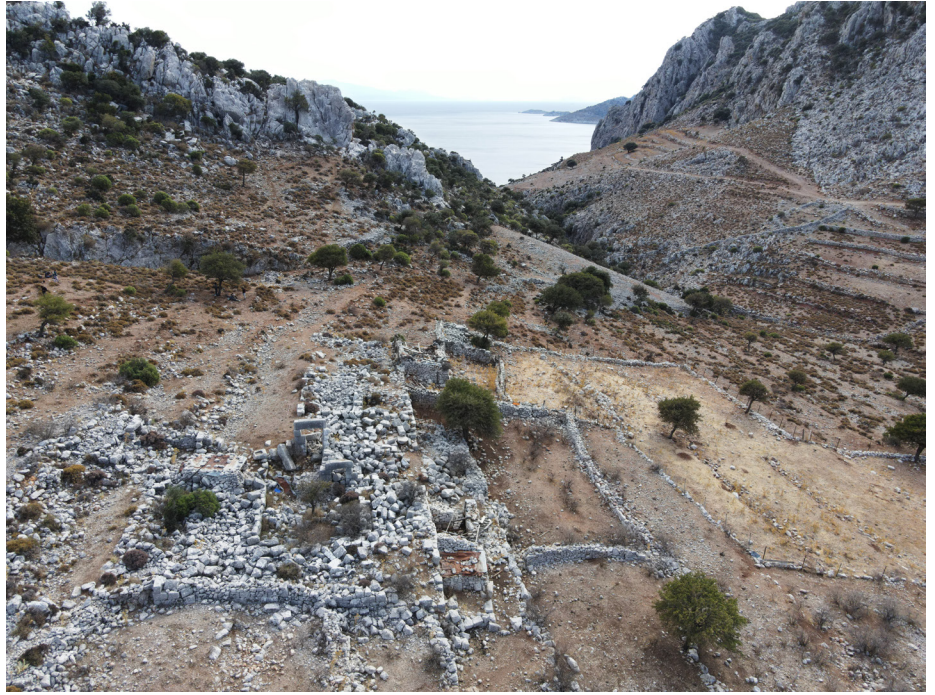
Gedik mevkii.

mezarlar, zeytinyağı işlikleri, bunlarla ilişkili sarnıçlar ve çiftlik yapıları gibi çeşitli nitelikte yeni veriler elde ettik. Bahçekise'de olduğu gibi bu alanda da kuzeyden gelen yolun çatallanarak doğuda Bahçekise - Kırkmermerler, batıda