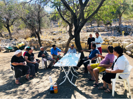
Taşlıca halkı ziyareti.