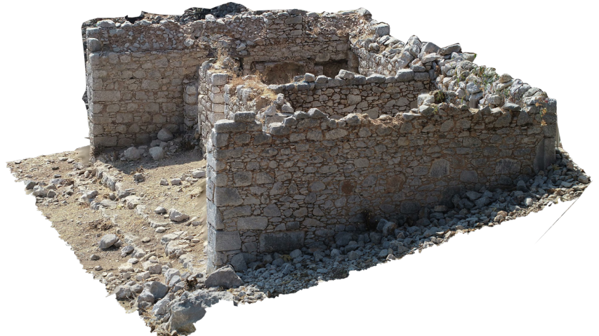
Aşağı Fenaket. 3D tarama: M. Serhat Aydemir