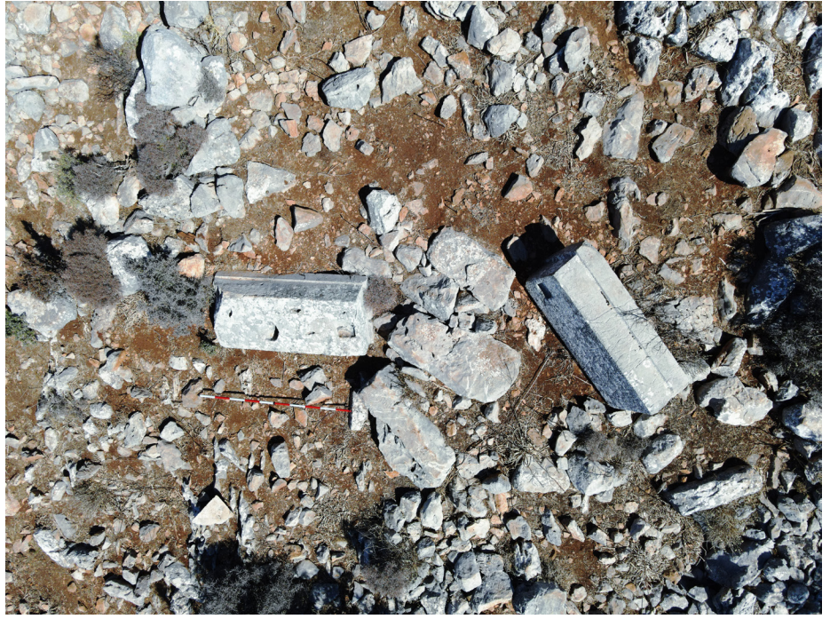
Çakallık Tepesi mezar blokları.

2022 yılı yoğun yüzey araştırmalarının ilk ayağında, Phoenix Kenti'nin akropolü olan Hisar Tepe'nin güneydoğu alt yamaçlarına konumlanmış olan