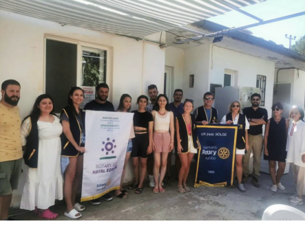
Marmaris Rotary Kulübü ziyareti.