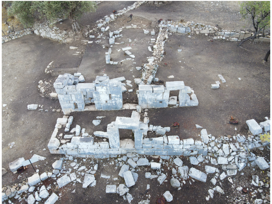
Apollon Kutsal Alanı ve Kızlan Kilisesi tepeden görünümü.