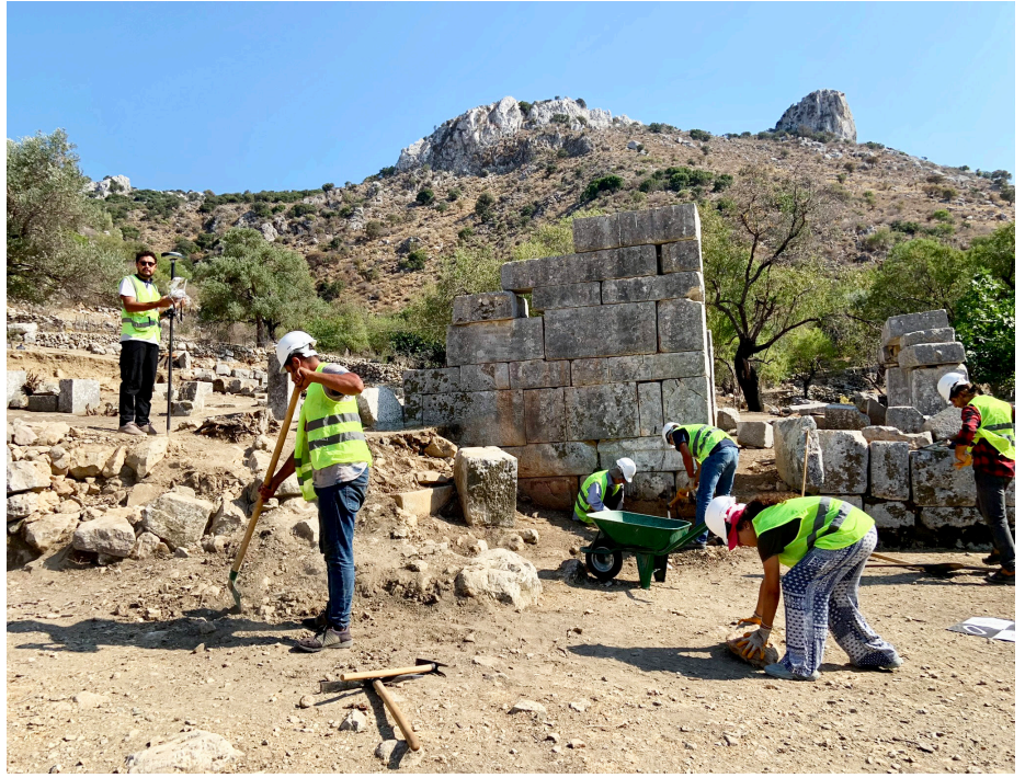
Kazı çalışmaları ve çevre düzenlemesi.

* Locus-Lot sistemine göre, yapının bulunduğu alan bir ana açma yani operasyon alanı olarak nitelendirilmiştir. Söz konusu ana açma içerisinde mekânsal, toprağın durumu veya veriye dayalı herhangi bir değişim durumunda alt açmalar ayrı birer Locus’a ayrılmıştır. Bu locuslar içerisinde kazısı gerçekleştirilen tüm tabakalar, en üst tabakadan itibaren numerik dilimler halinde Lot'lara ayrılmıştır.