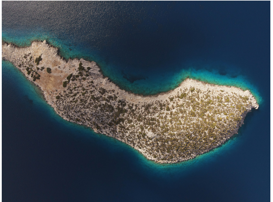
Taşlıca Adası tepeden görünümü.