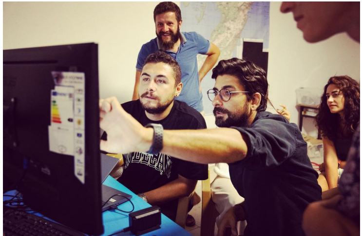
PAP ofis çalışmaları.

Phoenix 2022 yılı ilk günkü heyecan ve azimle, arkeolojik kazı ve yüzey araştırmaları başta olmak üzere tüm alt programlarıyla son derece başarılı geçti. 5 Temmuz – 30 Eylül tarihleri arasında gerçekleştirdiğimiz saha çalışmalarında, geçtiğimiz yıl olduğu gibi 3 yeni nesil yaklaşımlarla arkeoloji, tarih, ekoloji, kültürel miras, mimarlık, gastronomi, çağdaş sanat ve sosyal sorumluluk projelerini çeşitli disiplinlerden bir ekiple yürüttük.