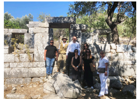
Marmaris Ticaret Odası ziyareti.